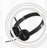
Headset Estéreo Lenovo™