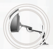
Suporte Lenovo™ com Ajuste de Altura