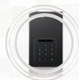
HD Protegido para Desktop Lenovo™