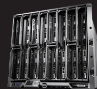
GRANDE INFRAESTRUTURA DE DIMENSIONAMENTO